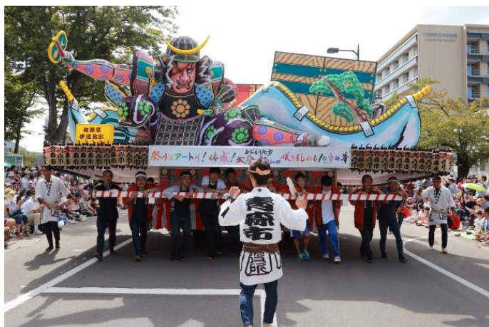
貸出画像「ねぶたの『独眼竜 伊達政宗』」