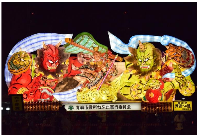
貸出画像「西遊記～天竺への道～」