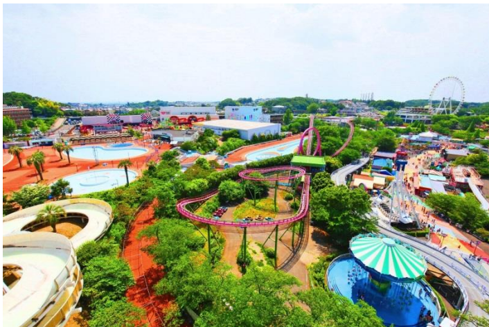
貸出画像「よみうりランド全景」

利用方法 入園口にて、お名前を証明できるものをご提示ください。ご本人様のみ有効。